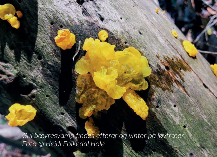
Gul bæuvresvamp findes efterår og vinter på løvtræer.