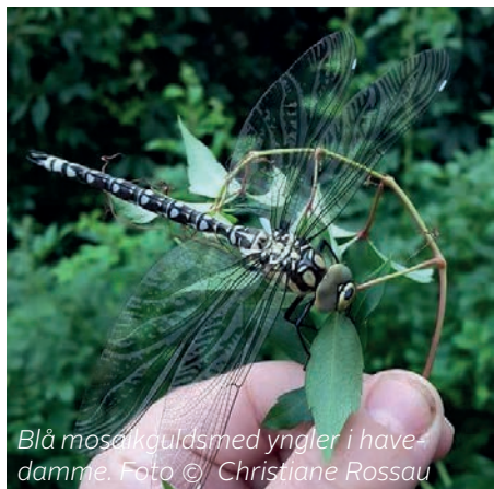
Blå mosaikguldsmed yngler i havedamme.