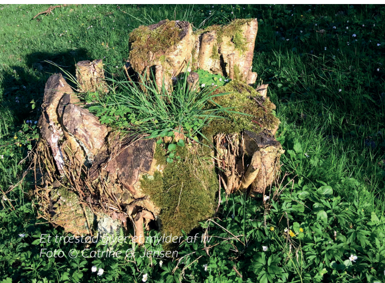
Et træstød bliver et nyder af liv