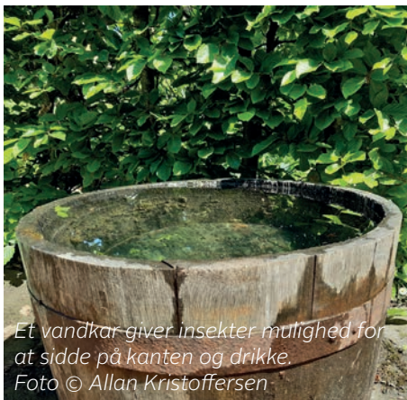
Et vandkar giver insekter mulighed for at sidde på kanten og drikke.